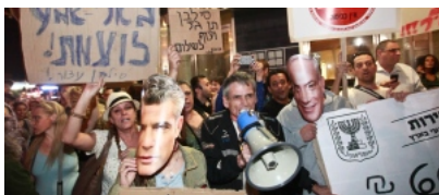
המחאה שורטת את כיסוי הטלפון של לפיד | 12.5.2013 | 09:28

העירייה שטבעה לפני 25 שנים, חזרה לפני הקרקע אי-פי | 9